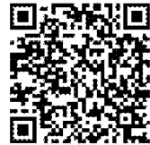
課程報名 QR CODE