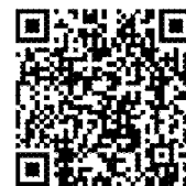
預約專人輔導 QR CODE