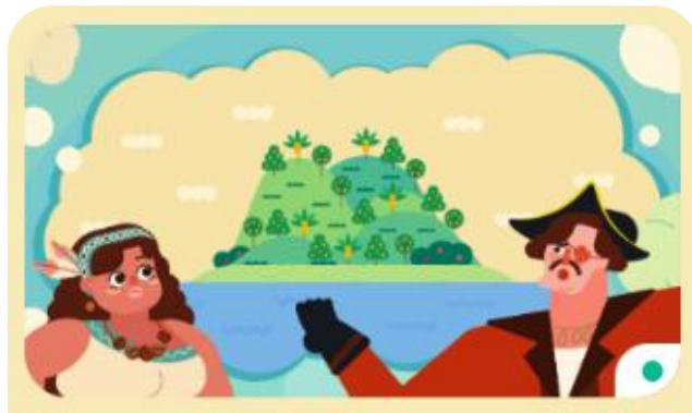
單元十：理財與投資 共3小節