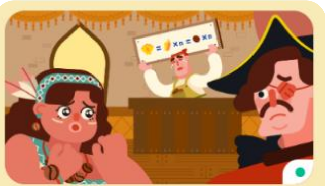
單元四：價格與價值 共4小節