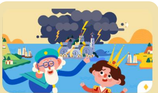
單元十一：保險與風險 共3小節