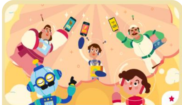
單元六：信用與支付 共4小節