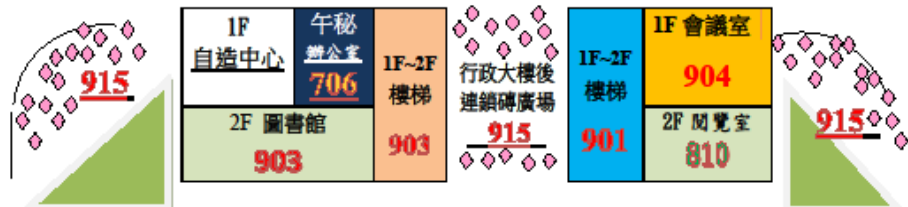
113 學年度上學期行政大樓辦公室、專科教室、廁所、樓梯掃區配置圖