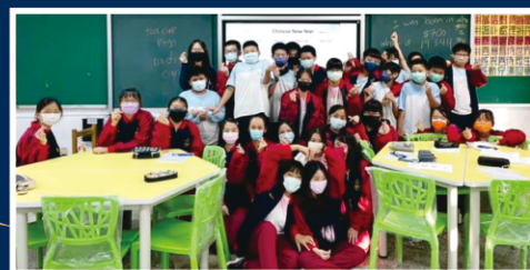
外師到校巡迴授課

申請外籍英語教師協同教學，早自修時間舉行聽力廣播，中午收聽ICRT News Lunchbox，進行口說評量，自編英語閱讀補充教材、開設英語社團。