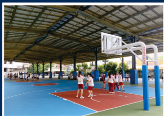
安全優質運動球場